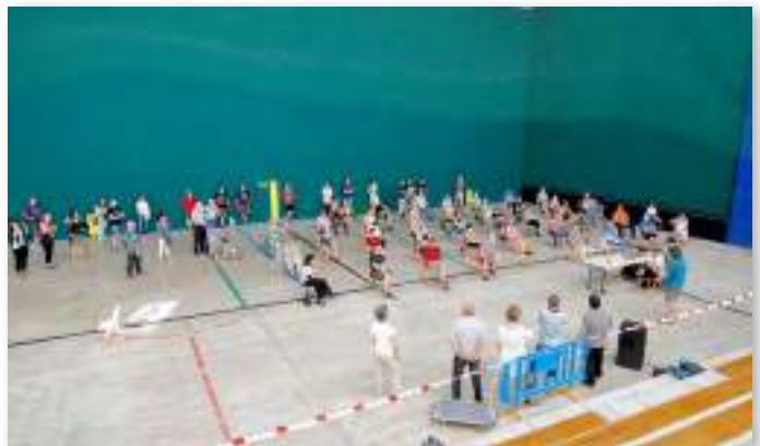
Un centenar de vecinos y vecinas de Puente la Reina/Gares en la presentación Gares Energía, el grupo motor que impulsa una comunidad energética en la localidad a partir de un proyecto municipal para recuperar la central mini-hidráulica "Electra-Regadío", y una instalación fotovoltaica en el Frontón municipal.

Una vez constituida y formalizada la CEL, es preceptiva una nueva actividad de presentación en la localidad. Un nuevo evento de participación abierta, donde dar a conocer el trabajo del grupo motor, presentar el proyecto en toda su extensión, sus objetivos, las instalaciones y servicios que va a proveer en el municipio, y la manera en que van a poder participar los vecinos y vecinas, las familias, en adelante. Es un momento también para recoger de nuevo impresiones, o incluso llegado el caso, anunciar la apertura de un periodo de solicitudes de conexión a las instalaciones de una instalación de autoconsumo.