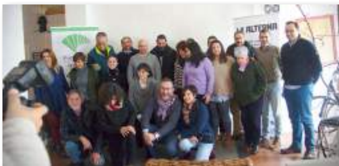
Acto de presentación de "La Alterna / Oficina Itinerante de la Energía", un proyecto piloto de la Asociación MUTI con Fundación Unicaja. En la imagen, alcaldes y concejales de El Real de la Jara, Cala, Cañaverale de León, Hinojales, Arroyomolinos de León. Y personal técnico de la ZTS Sierra de Aracena, Megara energía, Cáritas y Consejería de Empleo de la Junta de Andalucía.

Se han hecho especialmente conocidas como centros de recursos para resolver dudas sobre la factura de la luz, cómo tramitar el bono social eléctrico, y asesoramiento para reducir el gasto eléctrico en los hogares. Informan sobre las tarifas eléctricas existentes, los diferentes tipos de compañías, y ayudan a determinar cuál es la mejor opción para cada familia. Son el centro neurálgico de la alfabetización energética del pueblo. Los ayuntamientos