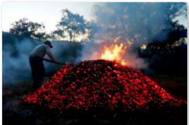
Haciendo "cisco" o "picón". Un combustible empleado tradicionalmente como calefacción en muchos hogares del medio rural. Se produce a partir de los restos de poda.