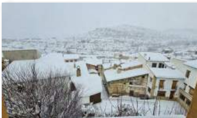
La red municipal de calor de Portell de Morella, municipio castellanense que abastece de agua corriente sanitaria y calefacción a todas las viviendas del casco urbano que lo soliciten.

La tecnología de aprovechamiento de la biomasa , normalmente por combustión directa, es la más económica y gestionable para la generación y consumo térmico. Siempre que haya, claro está, restos agrícolas y forestales procedentes del ecosistema agrícola de proximidad: explotaciones forestales, hortofrutícolas o por ejemplo instalaciones de la industria del aceite de oliva. Las redes de distribución de energía térmica o "redes de calor", pueden llegar a cubrir las necesidades de toda una población.