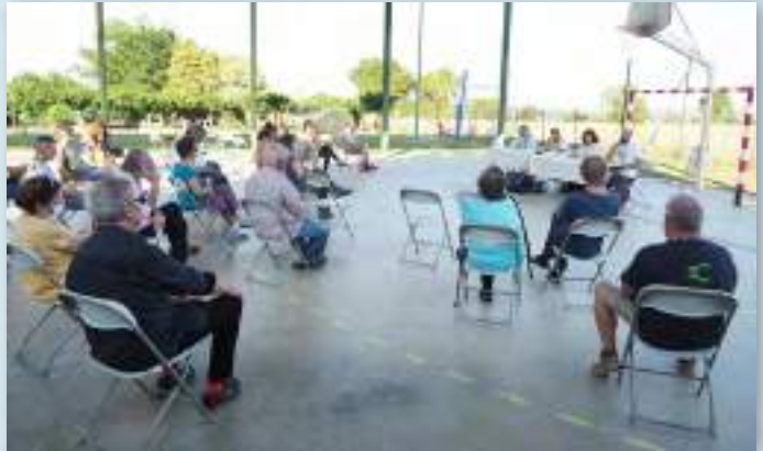
Presentación de la Comunidad Local de Energía de Rupió (02/07/2020). Acudió un nutrido grupo de vecinos y vecinas de esta localidad del Bajo Ampurdán, de menos de 300 habitantes.

se abran a la participación más activa de los recursos distribuidos de la propia ciudadanía, conectándolos a la plataforma en beneficio de la comunidad. La gestión de los propios consumos familiares a través de una sencilla aplicación móvil, la capacidad de extraer conocimiento sobre los flujos energéticos del municipio, y la forma sencilla como se ha abordado la gestión del reparto del autoconsumo colectivo, convierten a Rupió en un modelo con un alto potencial de replicación