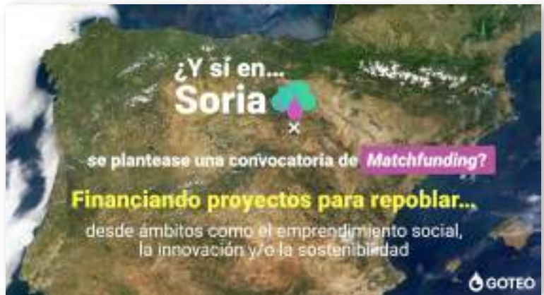
Goteo es una plataforma de crowdfunding con numerosos casos de éxito en matchfunding, y una vinculación creciente con el medio rural. Presentación de Goteo en la IV Reunión de Primavera sobre emprendimiento social, finanzas sociales y despoblación en Europa en el coworking El Hueco (Soria). ( elhueco.org/socialmeeting/ponencias/2018/mesa-3/mauricio-obrien.pdf ).

Los proyectos con más apoyo ciudadano son candidatos al “ matching ”, es decir, al apoyo empresarial o institucional de diversas maneras. Por ejemplo, doblando la cantidad aportada cuando llega a un umbral (si llega a 1.000 €, la empresa aporta otros 1.000 €), o completando la financiación hasta el óptimo deseado cuando alcance un % de financiación ciudadana. Ambas fuentes de financiación (la “grande” y la “pequeña”), quedan vinculadas durante la campaña de microfinanciación, creando un efecto multiplicador en las donaciones.