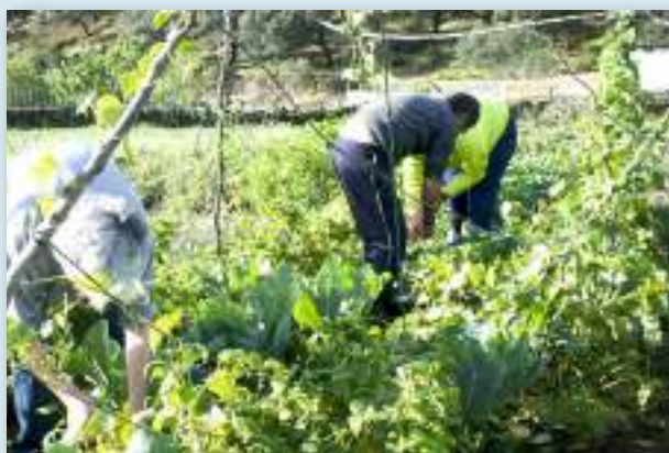
El proyecto "Tomates Felices", una iniciativa que ligaba el cultivo de la huerta tradicional con la inclusión social y laboral de las personas con discapacidad.

MUTI ( asociacionmuti.com ) es una asociación que podemos enmarcar en el ámbito de las "nuevas ruralidades". Una red de personas con vínculo con el entorno rural, que apuestan por el desarrollo sostenible en lo económico, social y ambiental. Se caracteriza por su afán en tejer redes y alianzas público-privada-ciudadanas. La energía se convirtió pronto en una de sus líneas de acción con más