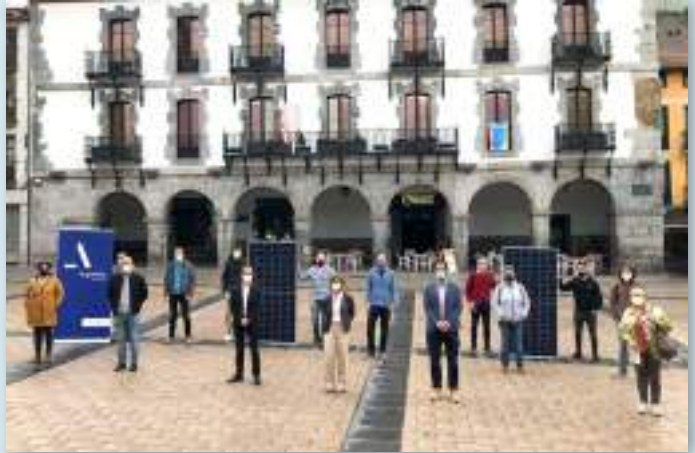
Azpeitia, 19 de mayo de 2021. Diversas entidades sociales de Azpeitia participan en la presentación pública de Ekindar, primera cooperativa energética local de Euskadi.

Carlos Beracierto Grupo KREAN cberacierto@kreat.com