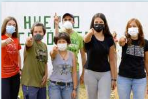
Momento del vídeo promocional de "La Energía del Cole", campaña de microfinanciación colectiva para la instalación fotovoltaica en la cubierta de la Ecoescuela Virgen de los Remedios.

J. Bosco Valero Palomo Asociación MUTI alumbra@asociacionmuti.com