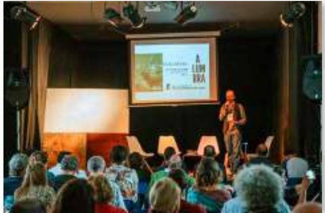
"ALUMBRA energía desde lo rural" unas jornadas de participación y diálogo sobre energía y vida cotidiana para el desarrollo sostenible del medio rural, y germen de la Comunidad Energética de Arroyomolinos de León (Huelva).

Esta fase del proceso termina con una acción de comunicación donde se devuelven a los vecinos y vecinas los resultados del evento. El formato