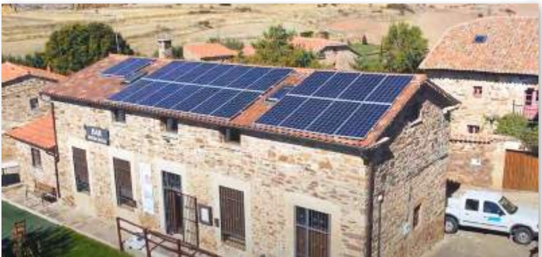
Castilfrío de la Sierra (Soria), acoge el proyecto Hacendera solar, una comunidad energética que cubrirá parte de la demanda eléctrica del municipio y ayudará a reducir las emisiones de carbono y el gasto energético de la localidad y de sus habitantes. Promovida por el Grupo Red Eléctrica, la cooperativa Megara Energía, el ayuntamiento y Caja Rural de Soria.

Durante este tiempo, y aun en el momento de redacción de este manual, han sido muchos los debates, las jornadas y encuentros, los desarrollos teóricos y las experiencias prácticas que han intentado arrojar luz sobre qué es y qué no es una Comunidad Energética. Existen diferentes propuestas y modelos, urbanos y rurales, con diferentes figuras jurídicas e interpretaciones de la normativa europea, casi siempre vinculadas a iniciativas de autoconsumo colectivo de energías renovables.