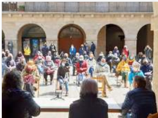
Jornada de la devolución pública del proceso participativo de la futura comunidad "Gares Bide", en Gares Puente La Reina (Navarra).

La mayoría de estas iniciativas surgen en el entorno de las cooperativas de energías renovables y organizaciones sin ánimo de lucro, aunque también de municipios con una notable trayectoria en políticas medioambientales y con experiencia en generación y/o distribución de renovables. En general, se definen a sí mismas como un instrumento para la gobernanza democrática de la energía , con el deseo de independizarse o aminorar la dependencia de las grandes empresas del sector, y comprometerse con el entorno local. La figura jurídica y el modelo organizativo que se escoja es importante, pero lo son mucho más las posibilidades que éste brinde para movilizar el tejido social y económico del municipio.