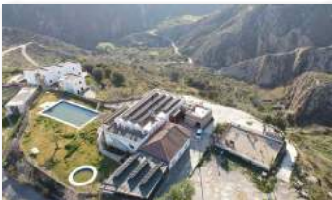
El municipio de Almócita (Almería) ha instalado 104 módulos fotovoltaicos sobre el Edificio de Usos Múltiples del ayuntamiento, que forman parte de su iniciativa de comunidad energética local.

La tecnología fotovoltaica es sin duda, por el bajo coste, debido a la abundancia de manera general de la fuente (el sol), y su operativa de instalación y mantenimiento relativamente sencilla, la mejor opción para la generación y autoconsumo eléctrico. Es modular y escalable, esto quiere decir que se ajusta a nuestro presupuesto inicial, y la misma instalación puede ir albergando paulatinamente más capacidad de generación y por tanto, más energía de proximidad y autoconsumo fotovoltaico para más personas.