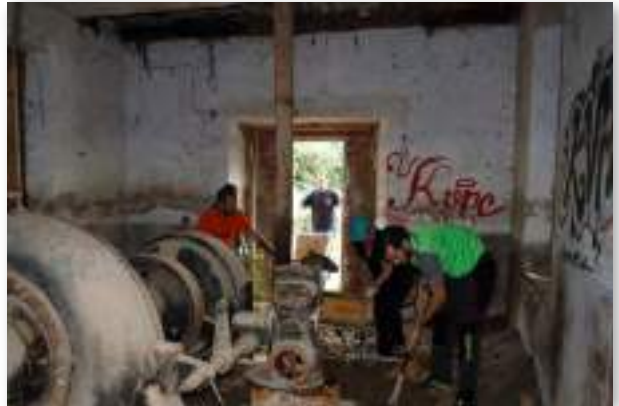
El Parlamento foral de Navarra mostró su apoyo al proyecto Gares Energía, que busca recuperar una antigua estación hidroeléctrica en activo entre 1918 y los años 80.

Sumado a instalaciones fotovoltaicas convencionales, estas soluciones híbridas con diferentes energías renovables que se complementan, tienen un gran