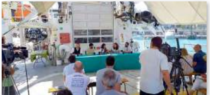
Vecinos del municipio granadino de Monachil visitan el 'Rainbow Warrior' de Greenpeace y presentan "Soleada Monachil" una compra colectiva, promovida por Cooperase (cooperase.org), de instalaciones fotovoltaicas para las familias del pueblo.

Es muy común entre las cooperativas vinculadas al sector de las energías renovables, solapar el propósito ambiental con el empoderamiento ciudadano, la cooperación y la democratización del acceso a un recurso básico como es la energía. Generan confianza, cohesión social y un sentimiento de contribución al bien común a través de redes de apoyo mutuo. Y tienen una presencia cada vez mayor en el mundo rural, donde el cooperativismo es además un modelo de empresa