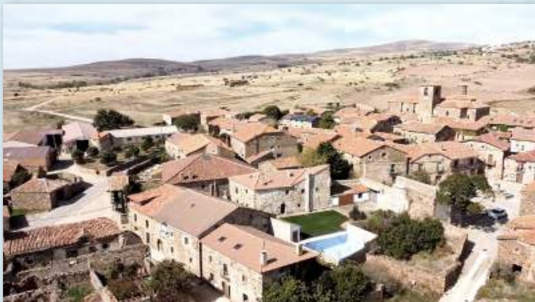
Imagen panorámica de Castilfrío de la Sierra. Al fondo en el centro de la imagen, se divisa la instalación fotovoltaica en el Centro Social de la localidad.

Castilfrío de la Sierra es un municipio del norte de la provincia de Soria, situado sobre la loma de San Miguel, muy cerca del Puerto de Oncala, en la Comunidad Autónoma de Castilla y León. Forma parte de la Mancomunidad de Tierras Altas y cuenta con 37 habitantes (INE 2020). Se encuentra situado en ladera, calles empedradas o encementadas distribuidas alrededor de la plaza, con grandes casonas de piedra, en su mayoría del siglo XVII. Conserva uno de los mejores conjuntos urbanos de la arquitectura tradicional merinera.