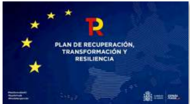
El Plan de Recuperación, Transformación y Resiliencia (PRTR) del Gobierno de España es el instrumento que va a vehicular el programa de inversiones y reformas para los años 2021-23 financiado con los fondos Next Generation.

También para identificar proyectos tractores para afrontar el reto demográfico y la lucha contra la despoblación. De estos últimos, de las más de 4.000 aportaciones recibidas, más de 2.000 corresponden a proyectos de transición energética.