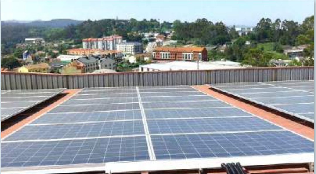
Instalación en la "Nave de Coregal", propiedad de la Comunidade de Montes Veciñais en Mán Común (CMVMC) de Tameiga. Con el acompañamiento de Nosa Enerxía y la colaboración de Montaxes Lagoa.

con tecnología fotovoltaica, y con diferentes modalidades: autoconsumo con compensación simplificada de excedentes y venta a la red. En total, se ha diseñado una potencia de generación de 270 kilovatios. Las previsiones diarias de producción y la gestión de la carga de estas permitirán que todas las personas comuneras y los socios industriales de la comunidad energética ajusten su curva de demanda a la de generación.