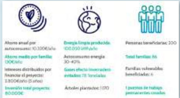
Tabla de datos del impacto esperado de la CEL "Albat 1: AlternaCoop" de Sapiens energía en Albat dels Sorells.