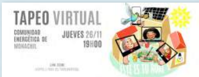
Imagen de difusión en redes sociales de una de las actividades de dinamización e información, actividad que no cesó durante el confinamiento decretado tras el estado de alarma por la covid19.