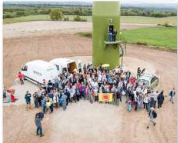
"Viure de l'aire del cel" (Vivir del aire del cielo) es una iniciativa de energía ciudadana en el municipio de Pujalt, Barcelona. Un aerogenerador que produce la electricidad equivalente al consumo de unos 1.600 hogares.