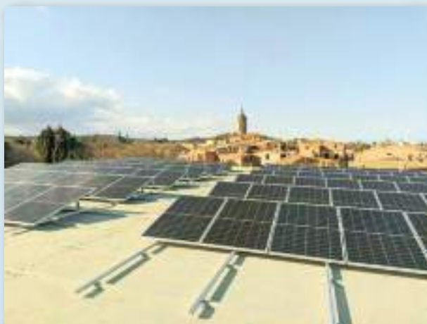
Instalación en la cubierta del polideportivo con una potencia en primera fase del proyecto, de 32 kWp ampliables.

La empresa KMOenergy ( km0.energy ) ha realizado los diagnósticos de potencial de generación fotovoltaica de todos los edificios públicos, las necesidades de consumo de la población, e identificado de la mano del ayuntamiento las viviendas con familias en situación de pobreza energética. También ha diseñado el sistema de gestión de datos y hecho los cálculos de reparto y las estimaciones de ahorro. Mediante un sencillo trámite de licencia para la cesión temporal de cuotas de participación de la instalación, usando la legislación vigente sobre "cesión privativa de bienes de dominio público", las familias pueden optar, por medio de un concurso público, a diferentes potencias de la instalación (0,5 kW o 1,5 kW), según sus consumos anuales y otros criterios publicados en las bases. Los ahorros esperados por familia rondan los 170/180 € anuales con un autoconsumo del 60 % de la participación asignada.