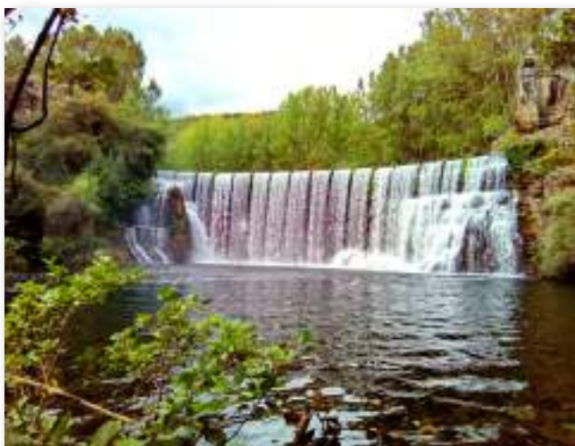
“Salto del Pelgo” en el municipio de Toral de los Vados (León).

El uso del agua como una fuente más para la generación de energía eléctrica permitió que surgieran iniciativas empresariales. Las hidroeléctricas originales se encontraban cerca de los centros de consumo, lo que sentó las bases para la generación de electricidad en las zonas rurales, con pequeñas centrales de ámbito local.