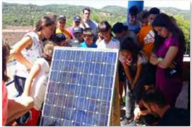
Alumnado del CEIP Virgen de los Remedios en una actividad sobre energías renovables de la Asociación MUTI y la Agencia Provincial de la Energía de Huelva, en el marco de la Semana Europea de la Energía.

Las distintas formas de calentarnos, de desplazarnos, de generar la fuerza motriz para el trabajo agrario, para moler el grano o iluminar nuestro hogar son manifestaciones de nuestra cultura, fruto de la tradición y la búsqueda de maneras de satisfacer las necesidades de la vida cotidiana de las comunidades rurales. Algunas han llegado hasta nuestros días traspasando generaciones y otras han caído en el olvido.