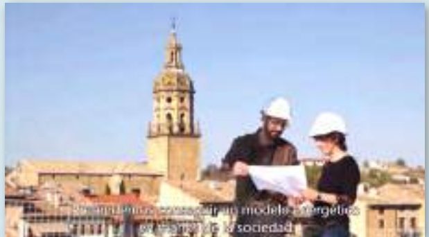
Captura de imagen del vídeo de presentación del grupo motor Gares Energía, donde se explica con detalle el origen, evolución y expectativas de la comunidad energética de Gares Puento la Reina.