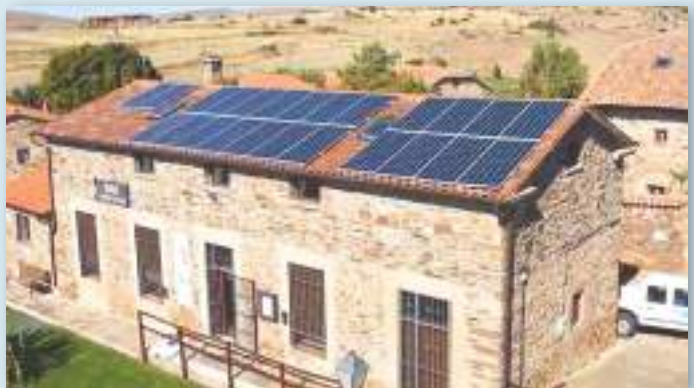
Instalación fotovoltaica en el Centro Social de Castilfrío de la Sierra.