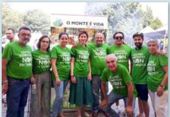
Los comuneros y comuneras de la Comunidade de Montes en Mán Común de Tameiga desarrollan una gran cantidad de actividades sociales y culturales, de defensa del patrimonio natural y dinamización comunitaria, con epicentro en el Centro Social As Pedriñas.

El propósito a corto plazo es constituir una comunidad energética local con figura jurídica propia cuando se apruebe la normativa correspondiente. En el futuro se quiere abordar la ampliación de la