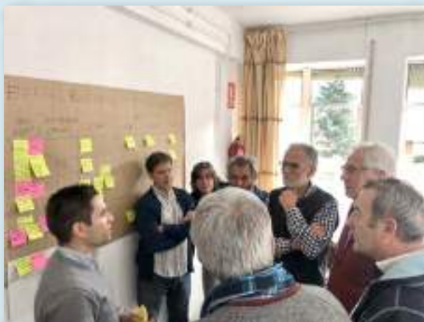
Taller participativo dedicado a la puesta en común de nuevas ideas y proyectos sobre energías renovables y tecnificación agrícola.