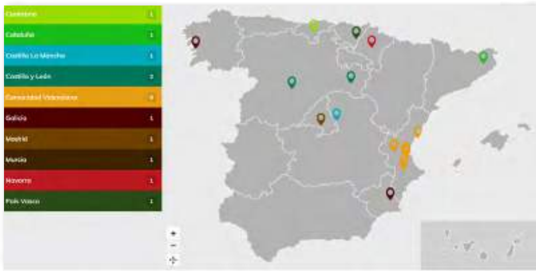
Mapa de distribución de las cooperativas comercializadoras de energía renovable en España. Más información sobre las entidades socias en la web de Unión Renovables ( unionrenovables.coop ).