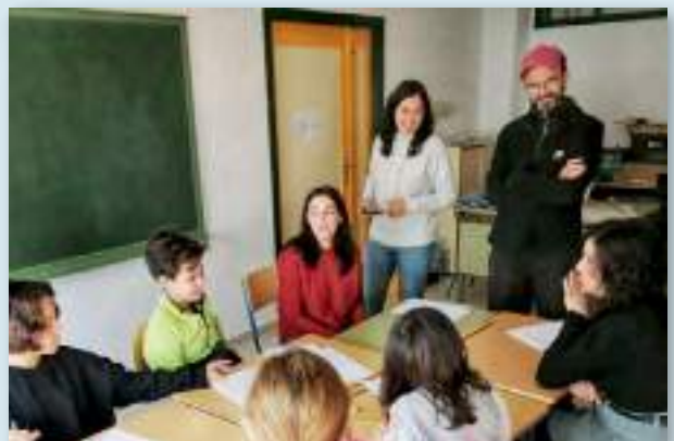
ALUMBRA en la Ecoescuela Virgen de los Remedios. Taller de auditoría energética tipo "Euronet 50/50".

La actividad principal de ALUMBRA será la de autoconsumo colectivo, en torno a dos instalaciones fotovoltaicas. La primera de ellas de propiedad municipal, con financiación del IDAE, que dará suministro en primer término a edificios municipales. La segunda, titularidad de MUTI, se enmarca en el proyecto "La Energía del Cole", que ganó el Renovathon de Greenpeace España ( greenpeace.org ) con una idea original de la cooperativa valenciana Aeioluz Evolución Energética ( aeioluz.com ).