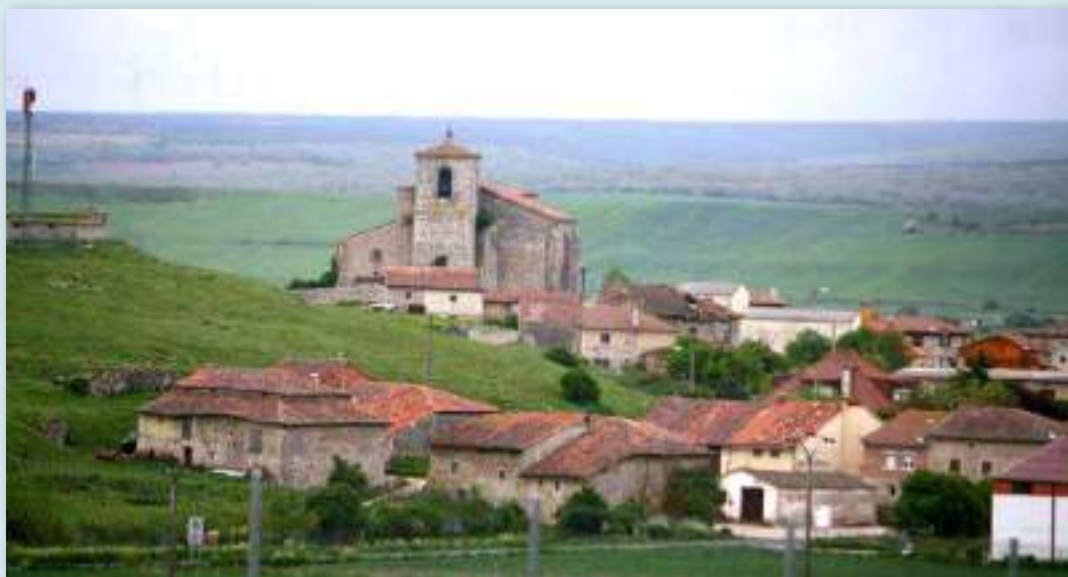
Agés está situado en el "Camino Francés" del Camino de Santiago.

Agés es una Junta Vecinal situada en la provincia de Burgos, comarca de Montes de Oca, perteneciente al ayuntamiento de Arlanzón, de poco más de cincuenta habitantes. La Junta Vecinal es heredera del Concejo, fórmula de gestión tradicional de los bienes comunes de origen medieval que persiste en la actualidad. Es una figura de administración local menor (o "segundo peldaño"), que se encarga de la importante tarea de gestión y administración de los bienes comunes (pastos, caza, aprovechamientos forestales) y las infraestructuras locales (abastecimiento y saneamiento de agua, iluminación).