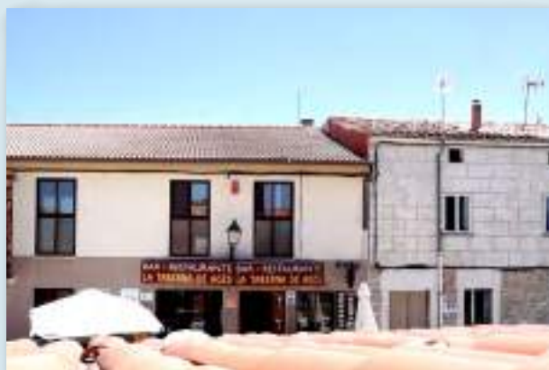
La cubierta del Albergue Municipal de peregrinos (a la izquierda de la imagen) alojará la primera instalación fotovoltaica de Agés, que abastecerá a edificios municipales, alumbrado y doce viviendas particulares de la localidad.