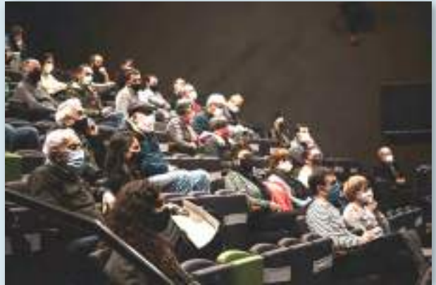
Presentación de la Comunidad de Energía Renovable de Hernani el 29 de abril de 2021. Una invitación abierta a participar con para definir el proyecto en los próximos meses.

solidaria, empoderada y respetuosa con el medio ambiente. En fase de presentación y llamada a la participación de la ciudadanía, esta comunidad energética tiene el valor añadido de formar parte de una estrategia de comunidades de la energía, donde Goiener está apostando por un modelo "Bottom up" (de abajo a arriba), con la figura jurídica de la cooperativa propia (local o comarcal). Otras localidades con procesos en marcha son Leizta, Lea Ibarra, Zestoa y Otxandio.