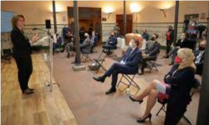
La vicepresidenta y ministra para la Transición Ecológica y el Reto Demográfico, Teresa Ribera durante la presentación de la Agenda Valenciana Antidespoblamiento (Estrategia AVANT 20/30).

animal y forestales), el cauce de un pequeño río, que le permite crear un sistema de dos almacenes de agua a distinta cota, y por tanto la instalación de una minicentral hidroeléctrica, y terreno propio para la instalación de un parque eólico y una planta fotovoltaica.