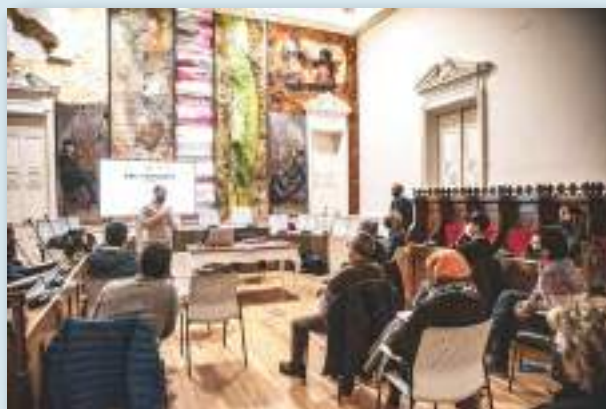
La dinamización de la participación ciudadana cuenta con el acompañamiento de la cooperativa Hiritik At ( hiritik-at.eus/es ).