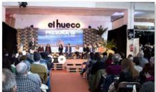
PRESURA "Feria nacional para la Repoblación de la España Rural" es un evento anual convocado por Cives Mundi y El Hueco Coworking. Un espacio de encuentro de iniciativas, visibilización de experiencias y creación colectiva, y punto de encuentro de las personas emprendedoras de los territorios de la España escasamente poblada. El Grupo Red Eléctrica patrocina esta feria y participa en las mesas redondas sobre "energía para la sostenibilidad rural".