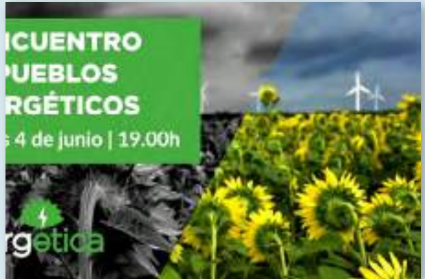
Energética Coop pone en valor los proyectos de Comunidades Energéticas Locales que trabajan para abastecer las necesidades locales maximizando la eficiencia y la adaptación. En los Encuentros de Pueblos Energéticos, abren espacios de debate para profundizar en los diferentes modelos de desarrollo energético en el medio rural (energetica.coop/ii-encuentro-de-pueblos-energeticos).

En la ordenanza aparece también la regulación del servicio de autoconsumo colectivo, que incluye acompañamiento en la eficiencia en los consumos, y el coste de la energía para las familias. Un enfoque participativo en la planificación energética local que incide además en una mejor adaptación