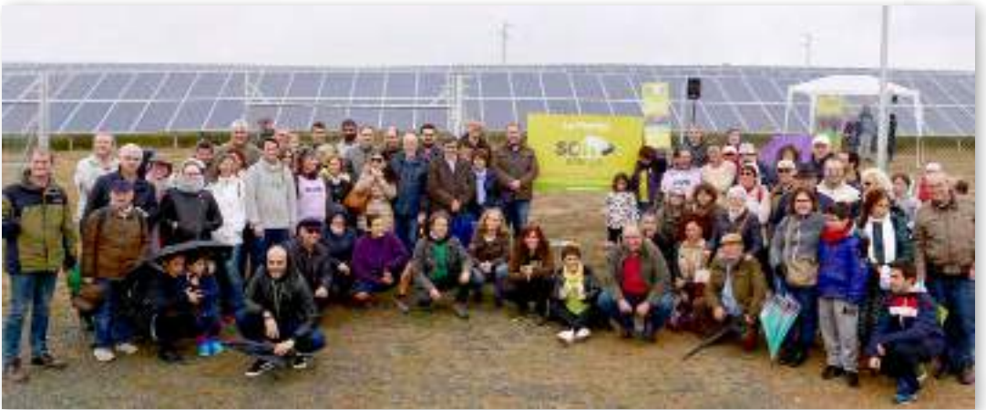
Parque solar fotovoltaico La Florida, en Lora del Río (Sevilla) financiado gracias a las aportaciones voluntarias de más de 1.600 personas socias.

Las cooperativas están haciendo un trabajo de sensibilización y movilización ciudadana que genera un apoyo cada vez mayor de la opinión pública hacia las energías renovables y el consumo responsable de energía.