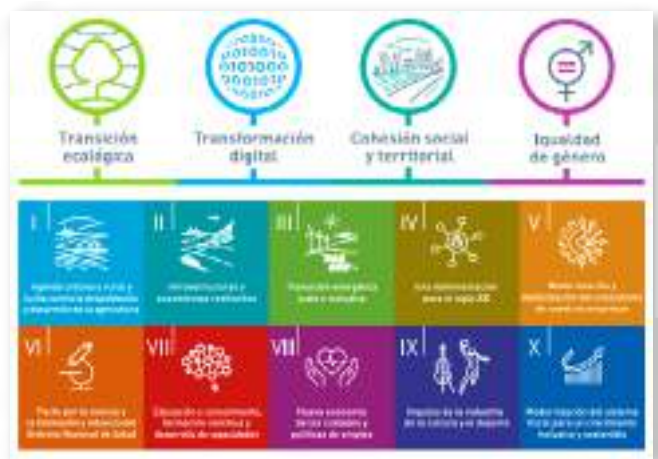
El Plan de Recuperación, Transformación y Resiliencia lo componen cuatro ejes que, a su vez, orientan a las diez “políticas palanca”. Una de ellas es la Transición energética justa e inclusiva (palanca III).