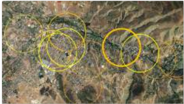
CooperaSE es una empresa de servicios energéticos que acompaña a la ciudadanía y las instituciones en sus proyectos de instalaciones de energías renovables. En la imagen, un diseño a futuro de la proyección de la Comunidad Energética del Río Monachil (CERM), a través de anillos o "roales" que circunscriben el radio de autoconsumo colectivo de las instalaciones.

Que nos ayuda a entender el funcionamiento de los diferentes elementos que conforman el sistema eléctrico (generación, comercialización, distribución, almacenamiento, agregación), diagnosticar las necesidades y potencialidades energéticas del territorio, dimensionar las instalaciones, redactar el proyecto y presupuestarlo de manera que se alinee con nuestro propósito socioeconómico, ambiental y de desarrollo de nuestra localidad.