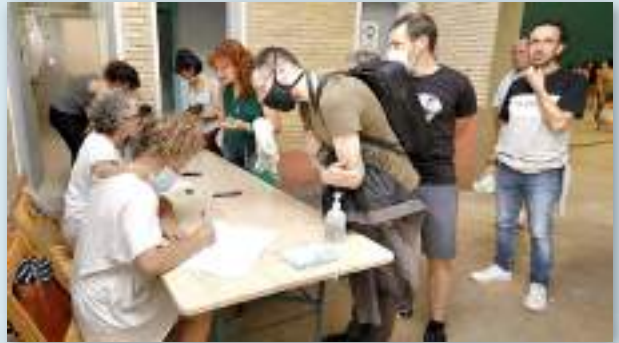
Un centenar de vecinos y vecinas de Gares acudieron a la presentación de "Gares Energía" al frontón municipal, donde se les explicaría el propósito y las fases del proyecto, el impacto esperado en la localidad y el proceso de comunidad energética en marcha.

Txetxu Ezkurra Gares Energía garesenergia@gmail.com