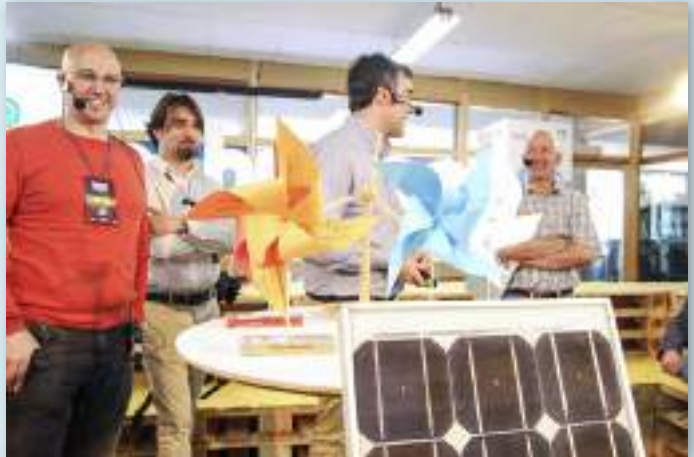
Presentación del prototipo de Comunidad Energética Rural del primer G100 de El Hueco Coworking (Soria), un grupo de personas de toda España en un proceso de co-creación de Nueva Ruralidad, basado en la gestión de la inteligencia colectiva.

Los excedentes vertidos a red se han acogido a la modalidad