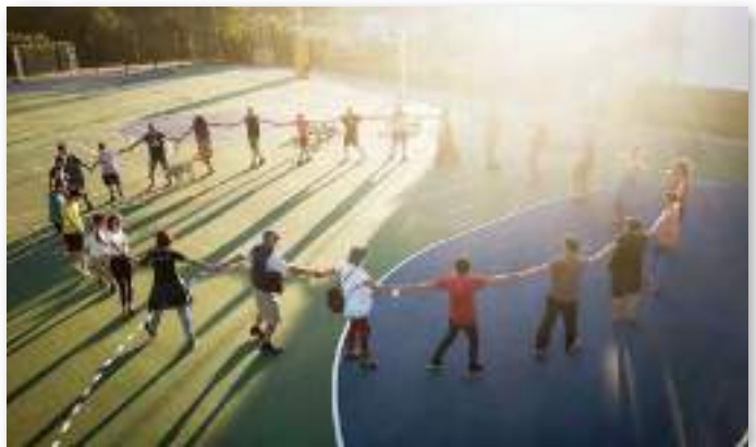
El grupo motor de la Comunidad Energética del Río Monachil celebra que ha conseguido, con fondos propios, poner en marcha sus instalaciones, parte en cubierta municipal y parte en tejados privados de personas autoconsumidoras, que ceden una parte de su producción a la comunidad.

En el caso de optar por una figura jurídica de cooperativa, además de la aportación inicial al capital, puede haber personas socias que en momentos puntuales hacen aportaciones al capital de la cooperativa, con algún tipo de compensación o retorno, para impulsar nuevos proyectos de generación de energía (o de otro tipo de servicio energético) y posibilitar así el crecimiento de la CEL.