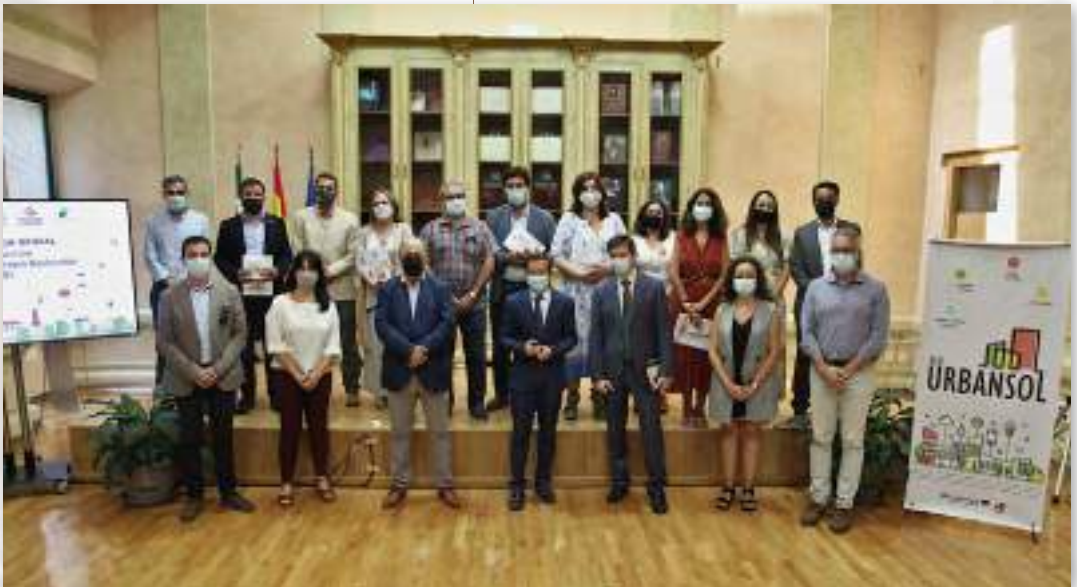
Acto de presentación de los primeros municipios de la provincia de Badajoz en suscribir el Pacto de las Alcaldías para el Clima y la Energía Sostenible (PACES) con los objetivos a 2030: San Vicente de Alcántara, Albuquerque, Talavera la Real, Olivenza, Villanueva del Fresno, Oliva de la Frontera, Jerez de los Caballeros y Fregenal de la Sierra (desarrolloruralysostenibilidad.dip-badajoz.es).

Economía circular, reciclaje y gestión de residuos, gestión del patrimonio natural... son temas que discurren en paralelo a la transición energética y movilizan compromisos en los mismos colectivos. Elaborar un informe breve y sencillo, que sea fácil de comunicar. Aportar información sobre logros y acciones que la ciudadanía pueda constatar es un buen punto de partida.