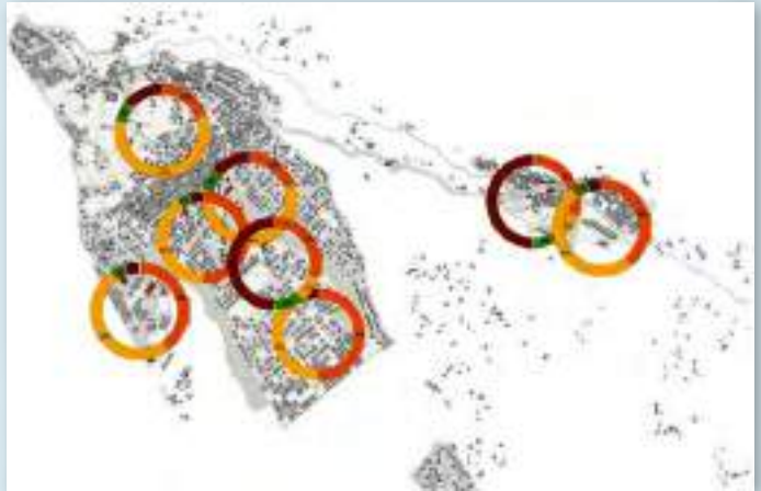
El código de colores indica la cantidad de energía generada por cada "roal" que será destinada al propio edificio (municipal en muchos casos), a las familias socias de la comunidad energética, otras en situación de pobreza energética, y cuánto se estima en excedentes de producción.

La comunidad se acoge a la figura jurídica de asociación sin ánimo de lucro, y como participantes personas físicas, pymes, y comunidades de vecinos, que podrán jugar diferentes roles dentro del reglamento interno de funcionamiento de la CERM: "autoconsumidora" (instalación particular que comparte excedentes con la comunidad); "consumidora" (consume energía dentro del roal); "inversora" (invierte económicamente en cualquier roal) y "facilitadora" (cede cubierta para instalaciones). Una parte de la generación se destinará, en todos los casos, a familias vulnerables.