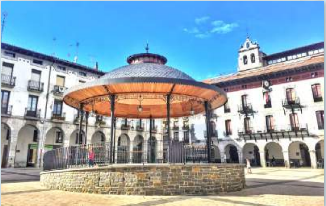
Plaza Mayor de Azpeitia

Azpeitia es un municipio de la provincia de Guipúzcoa, en el País Vasco. Pertenece a la comarca de Urola Costa, con una población de 15.106 habitantes (INE 2020). En su término municipal se halla Loyola, cuna de San Ignacio de Loyola. Alrededor de su casa natal se ubica un complejo monumental y religioso.