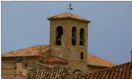
Torre de la iglesia barroca (S. XVI).