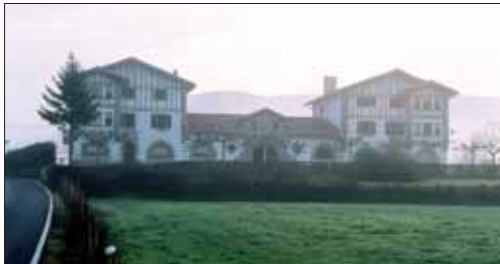
El Ayuntamiento de Uztama será rehabilitado con cargo al Fondo Estatal.

En general, muchas de las obras son de pequeña o mediana magnitud o no requieren grandes proyectos, entre otras cosas por la falta de plazos. Por otra parte, buena parte de las obras elegidas requieren de usos intensivos de mano de obra, con lo cual cumplen con el espíritu del Fondo, de crear empleo. Rehabilitaciones, construcciones o habilitación de espacios públi-