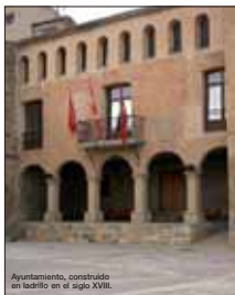
Ayuntamiento, construido en ladrillo en el siglo XVIII.