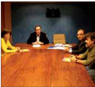
Un momento de la firma del convenio.

Esta es la segunda ocasión en la que varios ayuntamientos y el Fondo Municipal promueven conjuntamente la ejecución de un proyecto de cooperación al desarrollo trienal. En años anteriores, mediante con el mismo modelo, se financió la instalación de cinco sistemas de agua potable, la construcción de letrinas para las mismas comunidades, acciones de reforestación y otras de formación en salud y organización ■