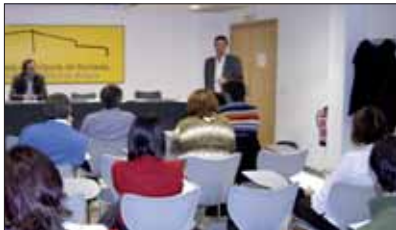
Una reunión de representantes locales sobre la red de teatros.

Como es habitual, La Federación continuará también con los servicios de asesoría, emisión de informes, participación en tribunales, formación de corporativos y técnicos, celebración de foros y jornadas, comunicación y edición de publicaciones, gestión de la tasa del 1,5% de gas y electricidad, mantenimiento de un Fondo de Cooperación al Desarrollo, y los que presta Geserlocal.