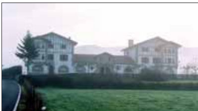
Utzamako Udala zahar-berrituko dute Estatuko Funtsaren kargura.

Proiektuak aurkezteko epea itxi arte aurkeztu direnatanik Ministerioak onartu duen obrarik garestiena Iruñeko Sanduzelai auzoko kirol-hiriko fase bati dagokiona da; 4,7 milioi euro. Data hartan, merkeena Galozera eskudal bat zen, 928 eurokoa.