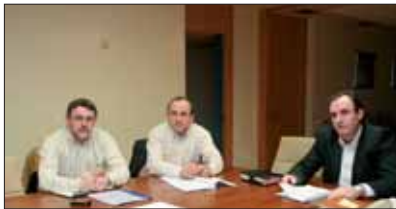
Miembros de la Ejecutiva en una reunión sobre el Fondo de Haciendas Locales.

los cargos públicos, y organizado y celebrado una nueva edición del Plan de Formación Continua de los Empleados Locales de Navarra.