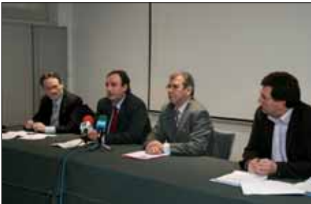
Imagen de una reunión convocada por la Delegación y la FNMC para animar a los ayuntamientos a crear plazas de TBC.

El pasado año, con motivo del cambio de legislación penal, y en especial por la criminalización de la conducción bajo los efectos del alcohol, se multiplicó el número de penas a trabajos en beneficio de la comunidad, razón por la cual, los Servicios Sociales Penitenciarios pidieron a los ayuntamientos que crearan o aumentaran el número de plazas.